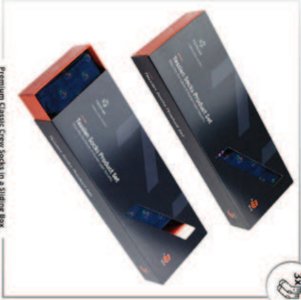
Premium Classic Crew Socks in a Sliding Box