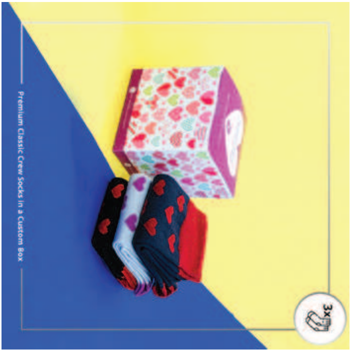
Premium Classic Crew Socks in a Custom Box