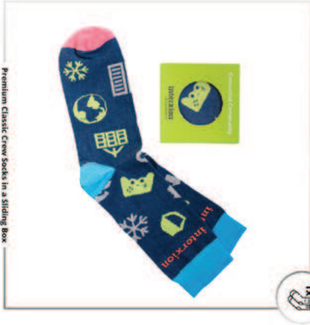
Premium Classic Crew Socks in a Sliding Box