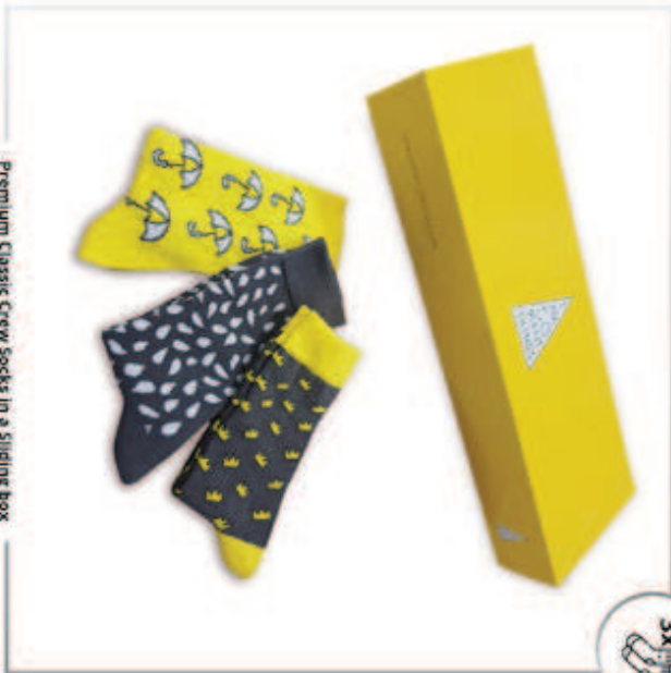
Premium Classic Crew Socks in a Sliding box