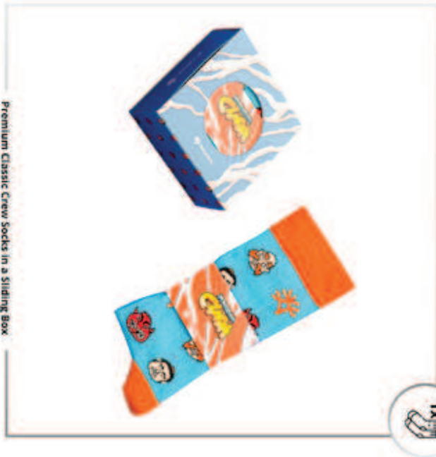
Premium Classic Crew Socks in a Sliding Box