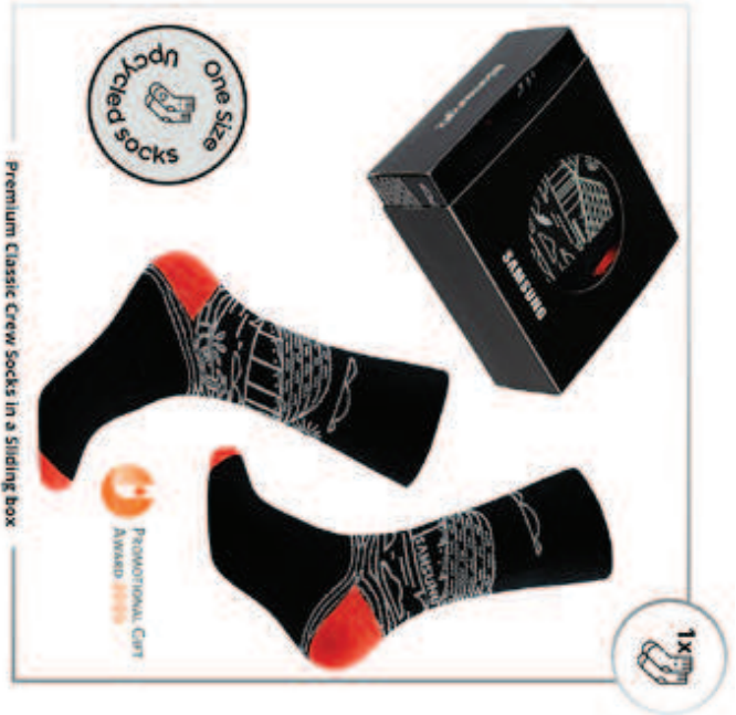
Premium Classic Crew Socks in a Sliding box