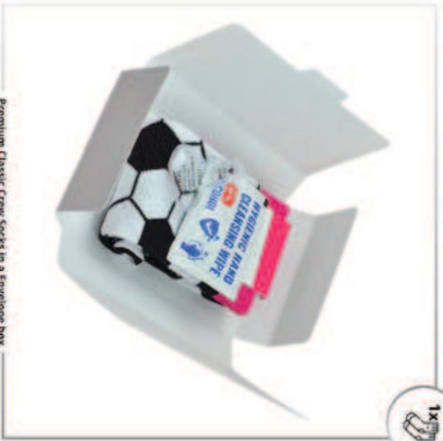
Premium Classic Crew Socks in a Envelope box