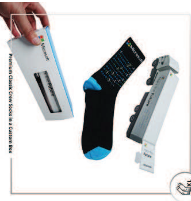
Premium Classic Crew Socks in a Custom Box