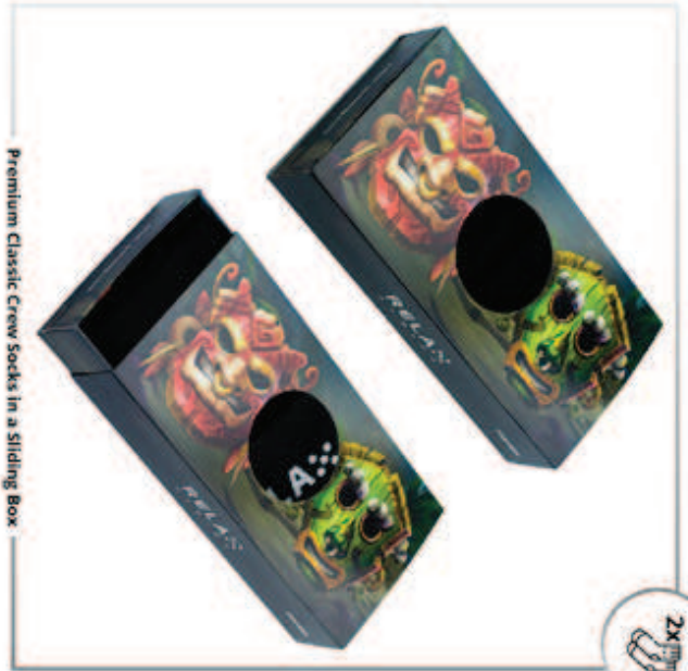
Premium Classic Crew Socks in a Sliding Box