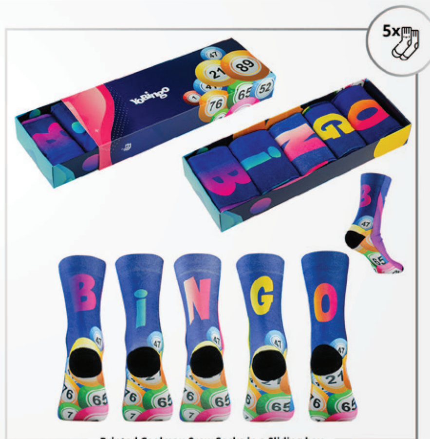
Printed Coolmax Crew Socks in a Sliding box

Composición: 90% COOLMAX para la comodidad y la transpiración, 8% de poliéster como refuerzo, 2% de elastano para añadir elasticidad.