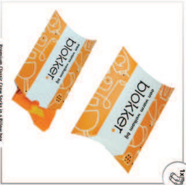
Premium Classic Crew Socks in a pillow box