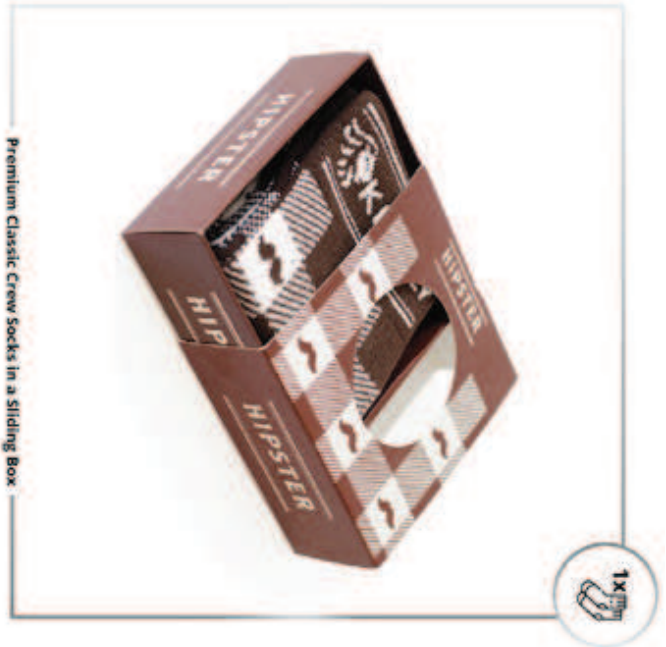
Premium Classic Crew Socks in a Sliding Box