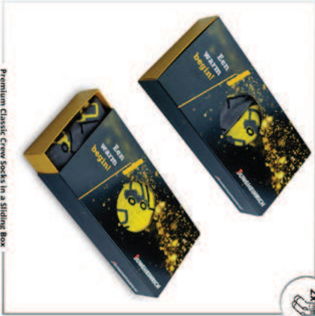
Premium Classic Crew Socks in a Sliding Box