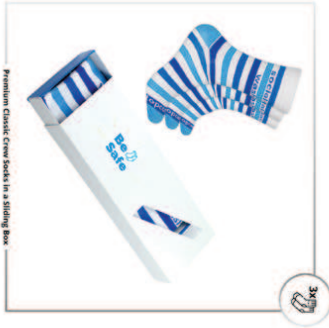
Premium Classic Crew Socks in a Sliding Box