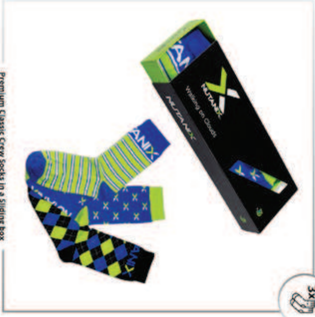
Premium Classic Crew Socks in a Sliding box