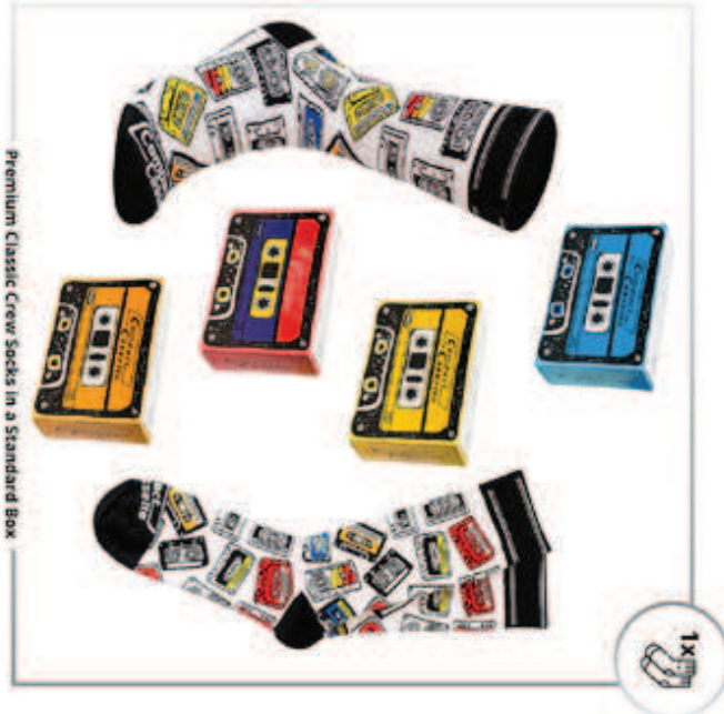
Premium Classic Crew Socks in a Standard Box