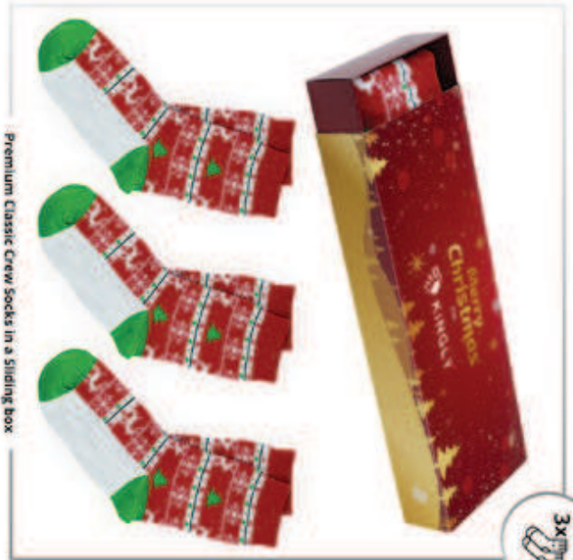
Premium Classic Crew Socks in a Sliding box