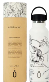
night flower 971761