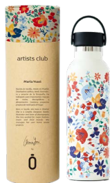
spring nata 971811