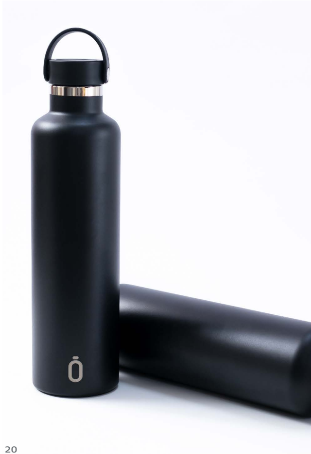
Runbott sport 1 l.