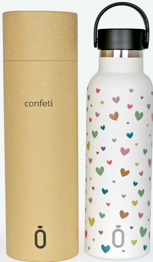
Runbott confeti 60 cl.