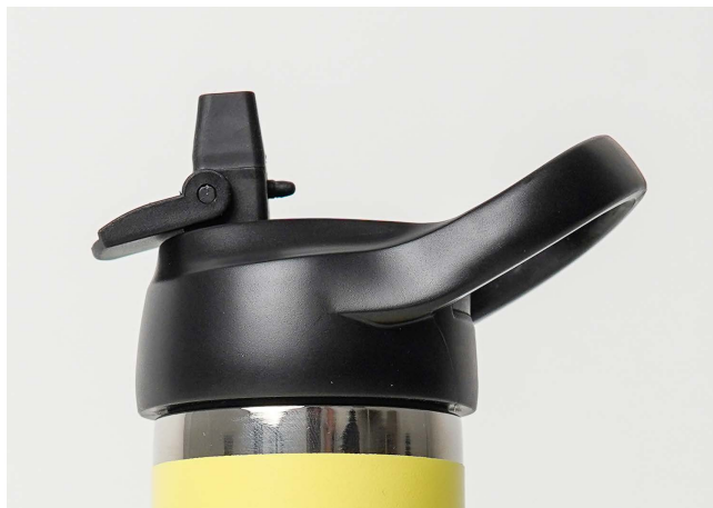
Runbott sport 35 cl.