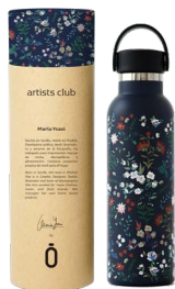
spring marino 971812